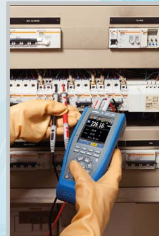
Mesures sur armoires électriques