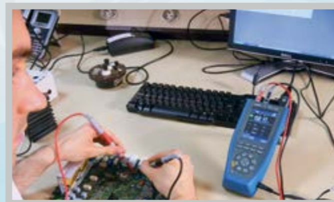
... ou en après-vente