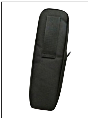
SC518: Sacoche de protection