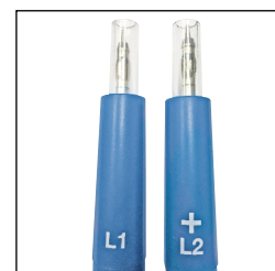
Pointes de touche IP2X

Le SEFRAM 66 est conforme à la nouvelle norme EN61243-3 et à la norme française UTE 18-510. Avec ses pointes de touches IP2X 4mm, l'utilisateur sera en sécurité en toutes circonstances. Le SEFRAM 66 est CAT III - 1000V et CAT IV - 600V. Il est équipé d'un autotest permettant de valider son fonctionnement et d'une double information de sécurité (en face avant et latéralement). Lecture directe sur un écran LCD rétroéclairé de la tension et de la polarité.