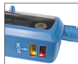
Double diode de sécurité et continuité